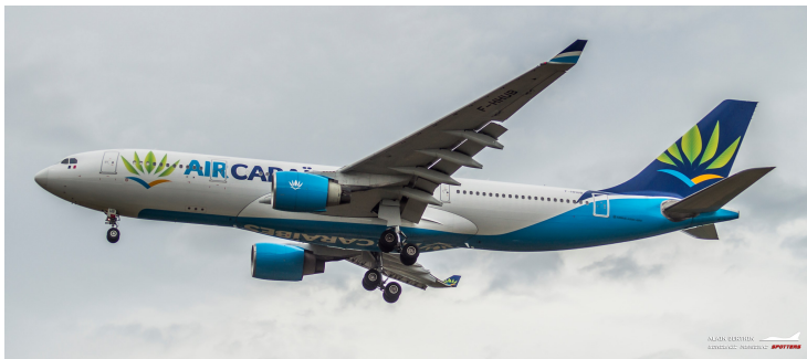
Arrivée à LFBD pour une visite technique de l'Airbus a330-200 (F-HHUB) de la compagnie Air Caraïbes .