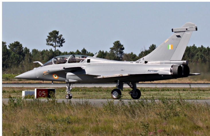
- Indian Air Force Rafale RB003