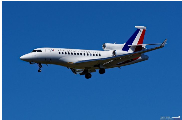
L'Airbus présidentiel et un falcon 7X de la république française de passage à BOD. L'escadron de transport ET 60 est basé sur la ba 107 de Villacoublay et assure le transport des autorités de l'état.