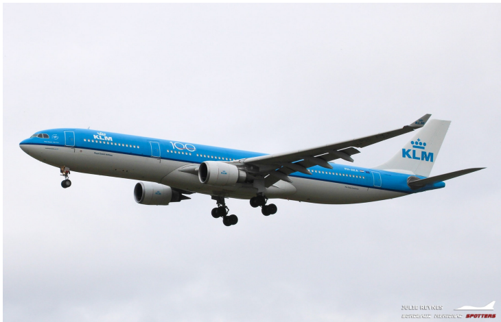
Il faisait beau 5 minutes avant...Les aléas du spotting ! Encore une arrivée pour Sabena Technics d'un Airbus a330-300 (PH-AKA) de la compagnie KLM avec un sticker « 100 » pour son centenaire.