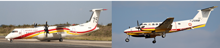
Sécurité Civile Dash 8-Q400 F-ZBMH et Beechcraft B-200 F-ZBMB