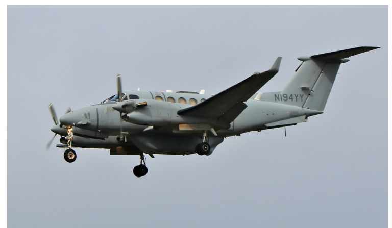
Beechcraft Super King Air 300 N194YY EUNAVFOR ( European Union Naval Force). Avion de reconnaissance et de patrouille maritime pour le Luxembourg (MPRA fleet).